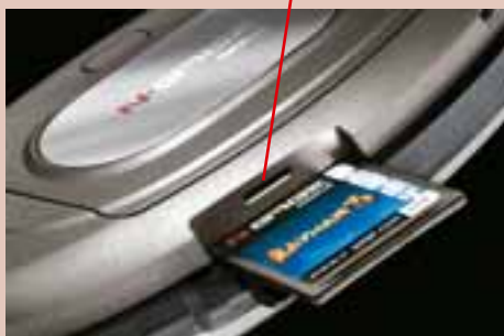
▲ MMC卡带插槽改在了主机底部,可以更方便的更换卡带。

N-Gage QD在外形设计上的一个重大改进之处就是改进了插卡方式,以前N-Gage换卡必须打开主机后盖,取出电池,相当麻烦,而现在N-Gage QD的卡带插槽放在了主机下部,可以方便地拔插卡带,而且这次还支持热拔插,也就是说不需要关闭手机电源便可更换卡带。N-Gage QD的屏幕大小与以前一样,仍然为176 x 208的解析度,最大色彩显示也没有提高,仍为4096色,但是屏幕显示效果作了一定改进,加入了高亮度模式,使得游戏的显示效果比以前更出色。 N-Gage QD的CPU规格以及内存大小都与原来一样,操作系统仍然是Symbian OS 60系列,仍然可以扩充普通的MMC卡,最高支持256M的MMC卡(N-Gage最高支持512M的MMC卡),因为使用Symbian OS这个开放的操作平台以及可扩充MMC卡,所以N-Gage QD仍可以像以前一样安装运行众多的S60系列的软件以及游戏。这次N-Gage QD内置了一个名叫“N-Gage Arena launcher”的软件,这应该是一个联网游戏平台软件。以前N-Gage上的不少游戏都提供有“N-Gage Arena”的网络排名的模式,相信现在这个软件就是为了更好更方便玩家进行网络排名、网络对战、联网合作等等,充分发挥手机游戏平台在ONLINE GAME上的先天优势。