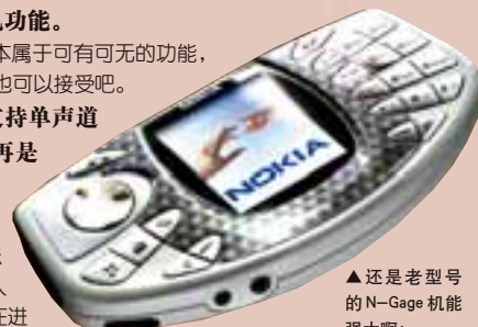
▲ 还是老型号的N-Gage机能强大啊!

这个缩水就比较麻烦了,以后N-Gage QD与电脑互传文件还必须给电脑配一块蓝牙适配器才行(目前国内市场上较便宜的蓝牙适配器也要200元左右),而蓝牙的传输速度也达不到USB的传输速度,所以取消USB接口会给人带来很大不便。